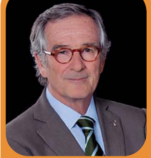
Xavier Trias Alcalde de Barcelona