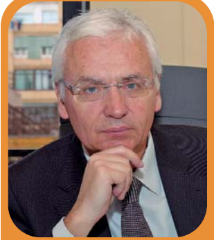
Ferran Mascarell Conseller de Cultura